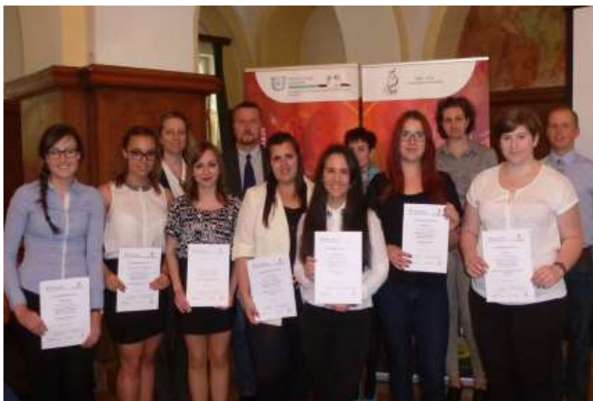
A konferencián bemutatkozó hallgatók és a konferencia bizottság