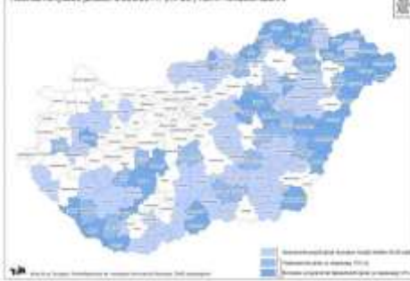
Kedvezményezett járások a 2005-14. (XI. 26.) Kormányrendelet szerint